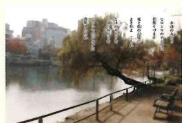
永遠のみどり(原民喜ゆかりの被爆柳)