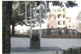
かけかへのないもの(原民喜詩碑)