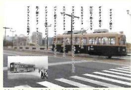
ギラギラノ破片ヤ(被爆した電車)