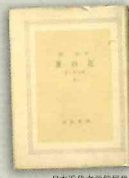
日本近代文学館蔵

我ハ奇蹟的ニ無傷ナリシモ、 コハ今後生キノビテ コノ有様ヲツタヘヨト 天ノ命ナランカ