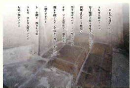
コレガ人間ノデス(人影の石)