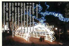
家なき子のクリスマス(ドリミネーション)